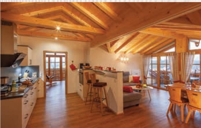
Wohnung Bergler | 72qm, 2. Stock

Helle Ferienwohnung mit Vinylboden und traumhaftem Bergblick, gemütlicher Wohnraum mit Ecksofa, Essecke, komplett eingerichtete Küchenzeile mit Induktionskochfeld und Backofen, separates Zirbenholz-Schlafzimmer mit 2m-Betten/offenes Fußende und Panorama-Bergblick vom Bett aus, private Zirbenholz-Infrarot-Wärmeliege, 2 Fernseher, großes Bad mit Regendusche/WC, Fußbodenheizung. Große Doppelbalkontüren zum Süd- und Westbalkon mit Rundum-Bergblick.