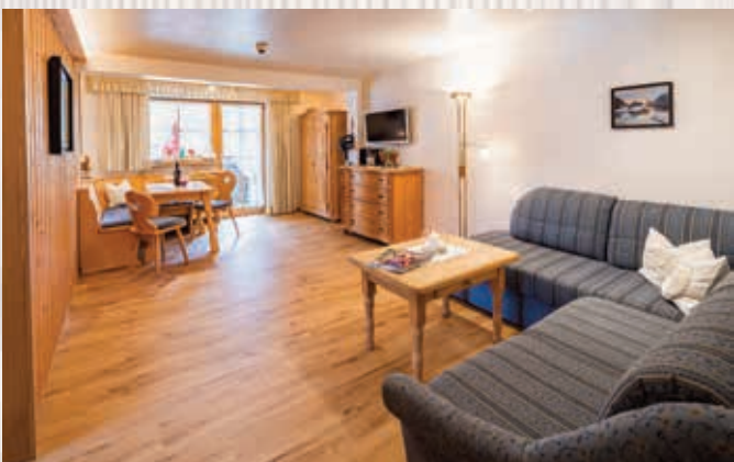
Wohnungen Höfats / 53qm

Einladende Ferienwohnung mit 2 separaten Schlafzimmern mit 2m-Betten, Vinyl-/ Teppichboden, Wohnraum mit bequemer Polsterbank, Sesseln und Zugang zum Südbalkon, separate Küche mit Spülmaschine, Backofen, Essbereich und Zugang zum Westbalkon mit Blick zur Hörnerkette und Nachmittagssonne, Bad mit Dusche/WC.