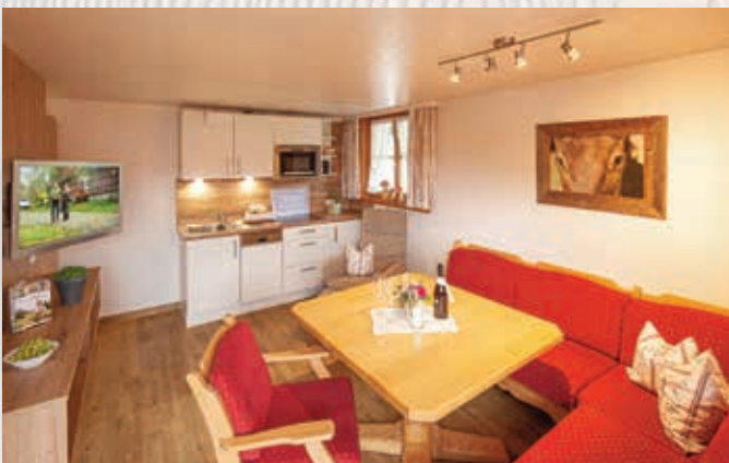
Wohnung Nebelhorn / 35qm

Geräumige Ferienwohnung mit Vinylboden, heimeliger Wohnküche mit Sofa, Sessel, gemütlicher Essecke und Zugang zum Ostbalkon mit Blick zum Rubihorn und Morgensonne, Küchenzeile mit Spülmaschine und Mikrowelle, separates Schlafzimmer mit 2m-Betten, Lesecke, großes Bad mit Dusche/WC.