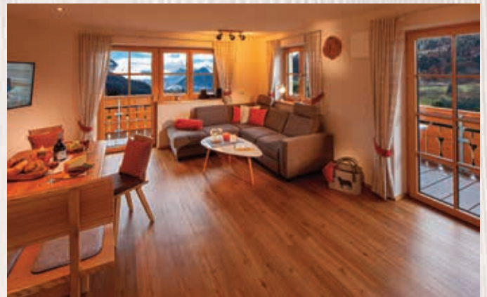
Wohnung Heuber | 62qm, 1. Stock

Helle Ferienwohnung mit Vinylboden, gemütlicher Wohn- und Essbereich mit Ecksofa, separates Schlafzimmer mit 2m Zirbenholzbetten/offenes Fußende, private Zirbenholz-Infrarot-Wärmeliege, große Doppelbalkontüren zum Westbalkon mit herrlichem Bergblick, komplett eingerichtete Küche mit Induktionskochfeld und Backofen, geräumiges Bad mit Regendusche/WC, Fußbodenheizung, 2 Fernseher.