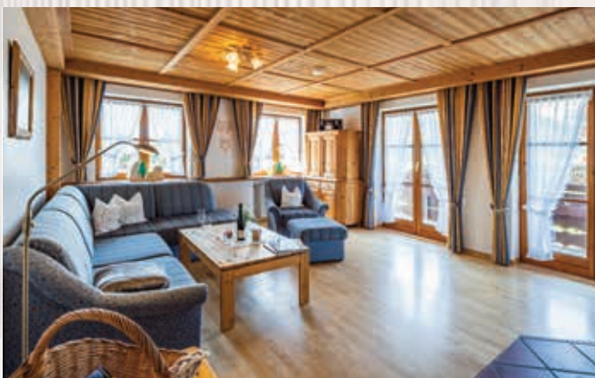
Wohnung Mädelegabel **** | ca. 100 qm, 1. Stock

Einladende Dachwohnung mit Sichtdachstuhl, Holz-/Vinylfußboden, heller Wohnraum mit gemütlichem Sofa, Essecke und Zugang zum privaten Südbalkon mit Bergblick, Diele, 2 separate Schlafzimmer mit 2m-Betten, separate Küche mit Spülmaschine und Backofen, Bad mit Dusche, separates WC.