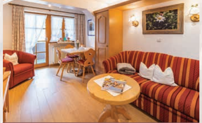
Wohnungen Himmelschrofen /ca. 53 qm, 1.+2. Stock

Raumwunder: 1-Raum-Ferienwohnung mit Vinylfußboden, gemütlicher Wohn- und Essbereich mit Fernsehsessel durch Rundbogen vom Schlafräum getrennt, 2m-Betten mit offenem Fußende, Küchenzeile mit Mikrowelle & Spülmaschine, Bad mit Dusche/WC, Westbalkon mit Blick zur Hörnerkette.