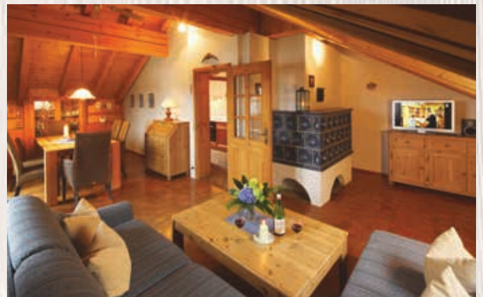
Wohnung Rubihorn **** | ca. 90 qm, 2. Stock

Helle, sonnige Ferienwohnung mit Vinyl-Fußboden, gemütliche Wohnküche mit Essecke, Fernsehsessel, Küchenzeile mit Spülmaschine und Mikrowelle und Zugang zur Südterrasse mit Garten, separates Schlafzimmer mit 2m-Betten und offenem Fußende, Diele, großes Bad mit ebenerdiger Regendusche/WC.