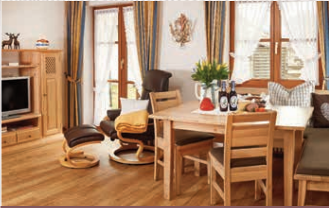
Wohnungen Entsenkopf **** | ca. 40 qm