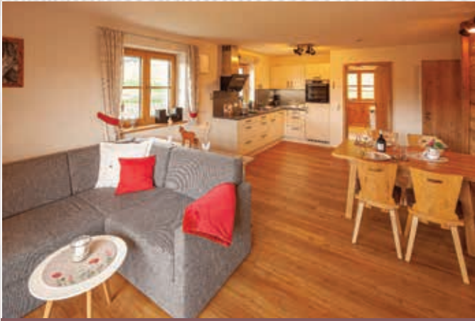
Wohnung Holzer | 55qm, 1. Stock