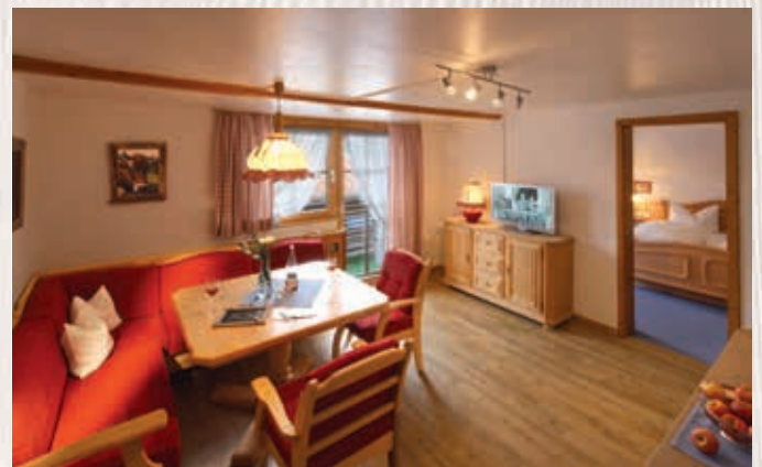
Wohnung Trettach / ca. 70 qm, 2. Stock

Behagliche Ferienwohnung mit Vinylfußboden, freundlicher Wohnraum mit bequemer Polsterbank, Fernsehsessel und Balkonzugang, Küchenzeile mit Spülmaschine und Mikrowelle, separates Schlafzimmer mit 2m-Betten, Bad mit Dusche/WC, Süd- oder Westbalkon.