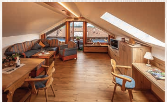
Wohnung Sonnenkopf / ca. 85 qm, 3. Stock

Geräumige Ferienwohnung mit Vinylfußboden, großzügiger Wohnraum mit Ecksofa, Essecke und Zugang zum Ostbalkon-/terrasse mit Blick zum Rubihorn und Morgensonne, separate Küche mit Spülmaschine, Mikrowelle und kleinem Esstisch, Separates Schlafzimmer mit 2m-Betten, Bad mit Dusche/WC.