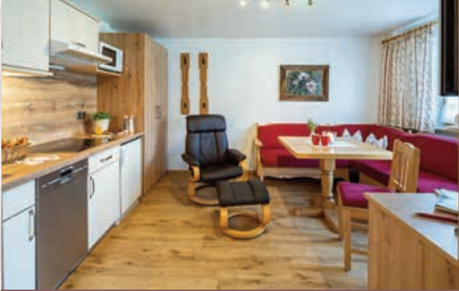
Wohnung Kratzer / 30qm